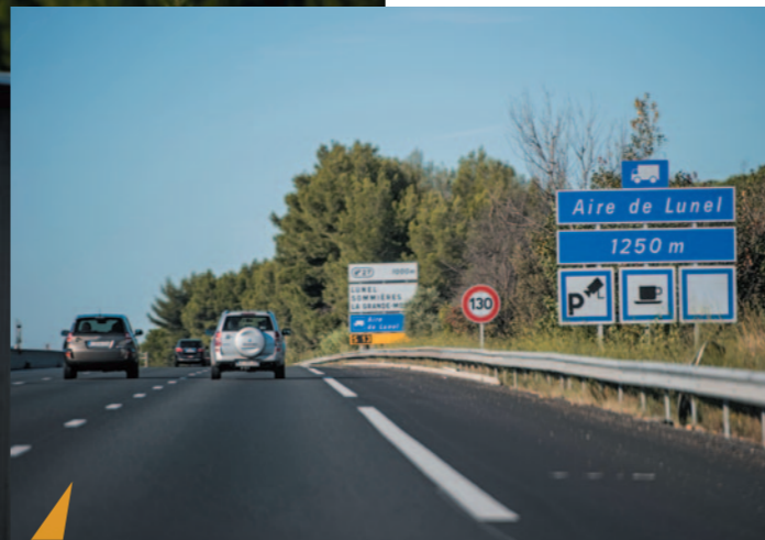
Vinci Autoroutes a expérimenté les parkings sécurisés dès 2004, et propose à ce jour 444 places sécurisées, comme sur le parking de Lunel (Hérault), actuellement proche de la saturation.