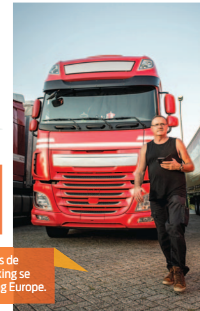
Les plateformes numériques de réservation de place de parking se multiplient. Ici, Truck Parking Europe.