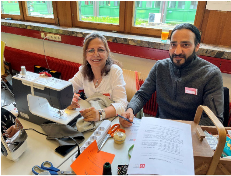
Foto: Die Reparateure und Reparateurinnen waren fleißig am Werk und hauchten defekten Alltagsgegenständen neues Leben ein.