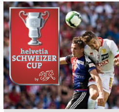
Presenting Partner des Helvetia Schweizer Cup seit 2016.