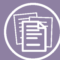
TABELLA DELLE VALUTAZIONI DEL GRADO DI INVALIDITA' PERMANENTE